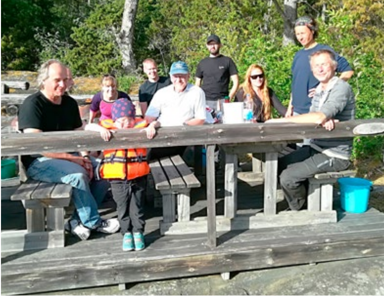
6-timmars-seglare på Bergskärs brygga 16 juni.

Torsholmen utan risk att fastna i kvällsbleket? Idag kunde det bli långa seglade distanser.