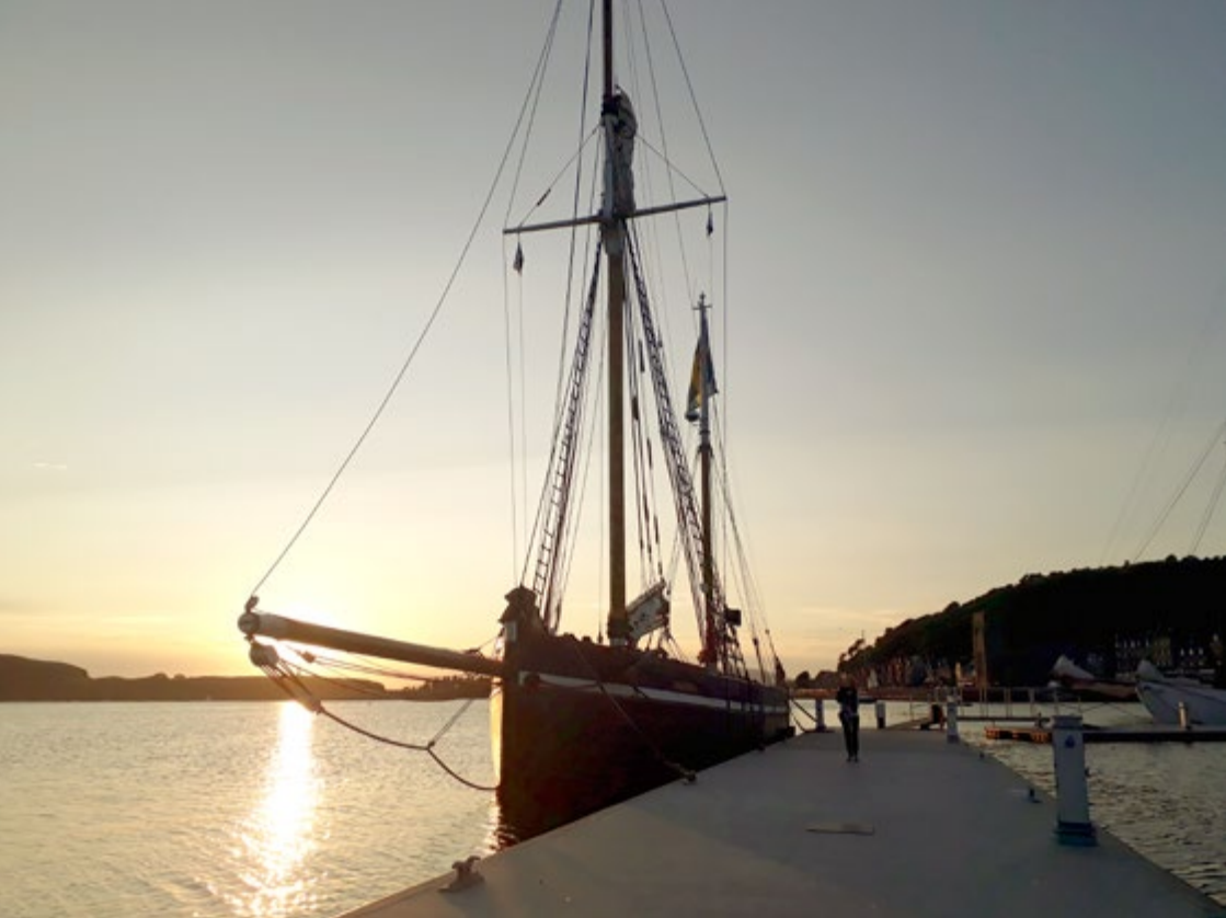
Atlantica , ett av Kryssarklubbens treskolfartyg.

var klar med månsken. Att stå vid rodret, känna fartygets tyngd, och hålla kursen, med den mäktiga fyren Cape Wrath, på skotska fastlandets nordvästra udde, blinkande över det svarta havet om styrbord, var en stark och oförglömlig upplevelse.