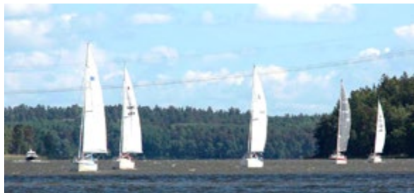
Eskader i Rökaleden 2016.